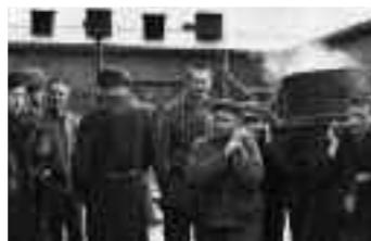
omstreeks 1940.

algemeen uit centrale afdeling en twee grote ruimtes van een houtconstructie. De barakken waren met wel 600 gevangenen volledig overbevolkt.