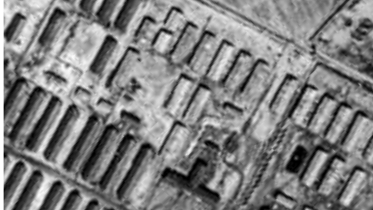
Foto onbekend (Fotoafdeling van de wehrmacht), omstreeks 1941 (DGLS).

om het leven. Zij moesten bij temperaturen onder nul urenlang naakt op het veld op hun kleren wachten.