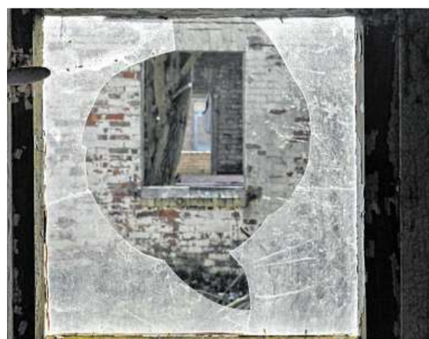
Der Blick durch eine kaputte Scheibe zeigt die sehr exakte Ausrichtung der Baracken.