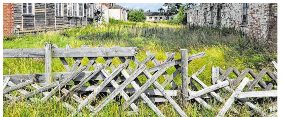
Blick zwischen zwei Baracken auf ein im Hintergrund zu sehendes Latrinengebäude auf dem Gelände der Gedenkstätte.