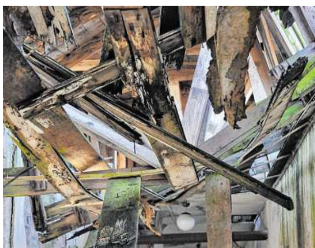
Ansicht des eingestürzten Dachstuhl im Flur einer der historischen steinernen Unterkunftsbaracken.