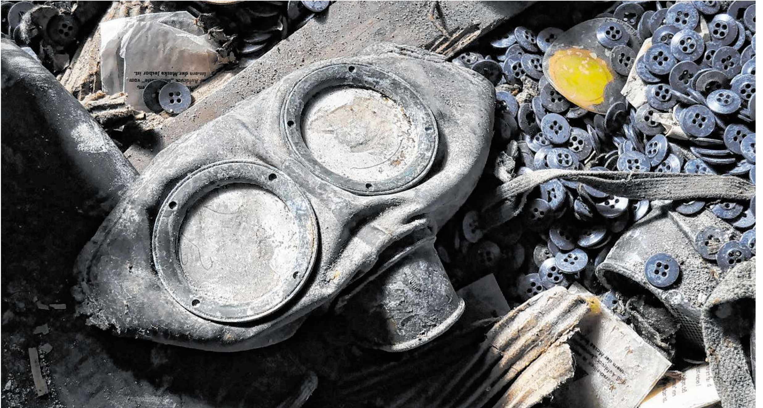
Die Reste einer Gasmaske und zahlreiche Knöpfe am Boden einer Baracke stammen nicht aus der Zeit des Kriegsgefangenenlagers Sandbostel, sondern aus den Hinterlassenschaften eines Militaria-Händlers.