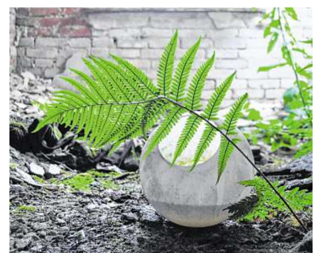
In vielen Bereichen machten sich unter den eingestürzten Dächern bereits Torfmoose und Farne breit.