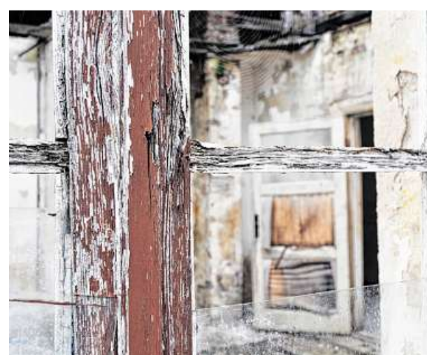
Blick durch ein Fenster in eine der Unterkunftsbaracken aus Stein.