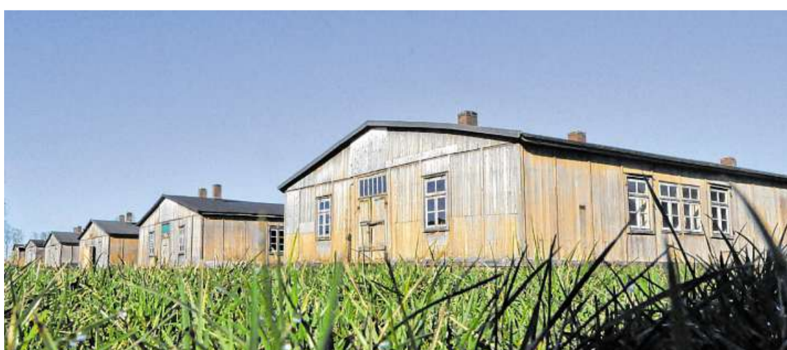
Ansicht des bundesweit einmaligen Ensembles parallel nebeneinander stehender Unterkunftsbaracken des ehemaligen Kriegsgefangenenlagers Sandbostel.